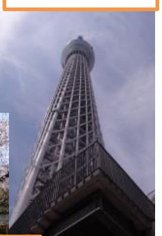
外出訓練 プログラム